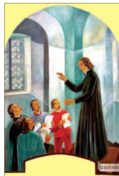
Az első Kántus című freskó az Oratóriumhoz vezető lépcsőházban

Minek köszönhető a Debrecenben képzett írók és költők tekintélyes névsora? A református tehetségek szinte törvényszerű ide áramlása mellett szerepet játszott a tanrend is, amelynek értelmében a poéták osztályának növendékei a költészet mesterségbeli fogásait tanulmányozták a legjobb klasszikusok példáján. A debreceni „bőség zavarában” – Szenci Molnár Albert, Csokonai, Fazekas, Kölcsey, Arany János, Ady, Móricz és Szabó Lőrinc árnyékában – gyakran megfedelkezünk a „második vonalról,” pedig kevés oktatási intézmény dicsekedhet Pálóczi Horváth Ádámhoz vagy Szentjóni Szabó Lászlóhoz hasonló növendékekkel, nem beszélve az ország műveltségére tömeges hatást gyakorló diákköltészetről, melynek népszerű alkotásait ezek másolták és terjesztették. A jeles irodalomirokrok az iskolatörténeti múzeum ereklyetára és dokumentumai segítségével emlékezünk.