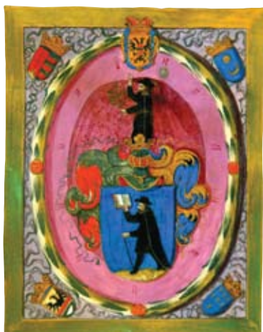
Részlet Szilágyi Tönkö Márton filozófiaprofesszor nemesi leveléből