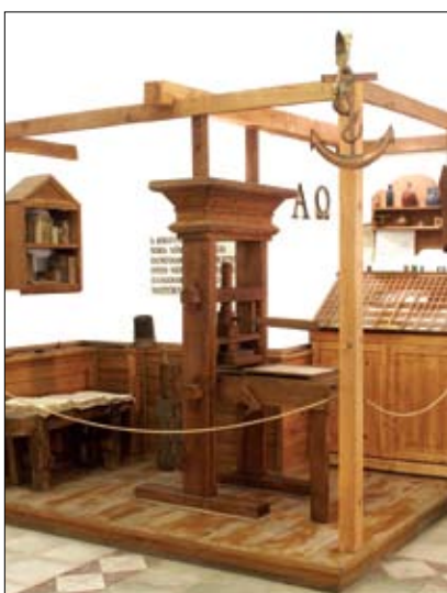
16. századi nyomdaprés rekonstrukciója

Debrecen történelmi szerepét joggal hasonlították Kálvin városáéhoz. A „magyar Genf” főként nyomdája és iskolája által vált véleményformáló nagyhatalommá. Míg a magyar nyelvű könyvek aránya a 16-17. századi Magyarországon 30% körül volt, Debrecenben meghaladta a 70%-ot. Amikor a nyomda alapítója, Huszár Gál „egész Magyarország és Erdély-ség világosító lámpásának” nevezte Debrecent, Kálvin Genfről szóló mondatát vette át: „Genfnek világitó lámpásnak kellene lennie, azok megvilágítására, akik még távol élnek az evangéliumtól.”