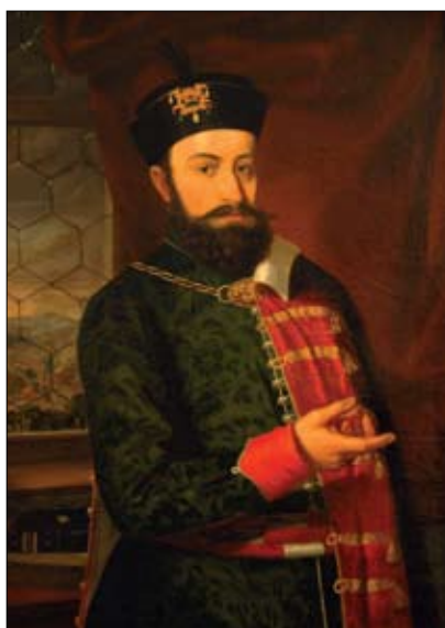
Kiss Bálint: Bocskai István portréja

Debrecen városának címere minden földrészén a magyar református egyházak jelképe. Központi részlete, az Agnus Dei – Isten báránya a város középkori építészetének legfontosabb emlékéen, a Szent András-templom gótikus zárókövén is szerepel.