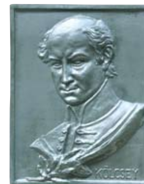
Kölcsey Ferenc domborműve a Kollégium főhomlokzatán

A Kollégium főként zenei téren ösztönözte a művészi hajlamú diákokat, így eleinte az ősi hagyományokat folytató énekkar, a szigorúnak híresztelt kálvinizmus „édes mollját” zengető Kántus szerezte a legtöbb barátot az iskolának. Az iskolai törvény a festés tanulását és gyakorlását is ajánlotta azoknak, „akik a természettől erre ajándékot nyertek.” Képzőművészetek terén az egész régióban új fejezetet nyitottak a rézmetsző diákok, jóllehet eredeti céljuk csupán a szemléltető oktatás segítése volt.